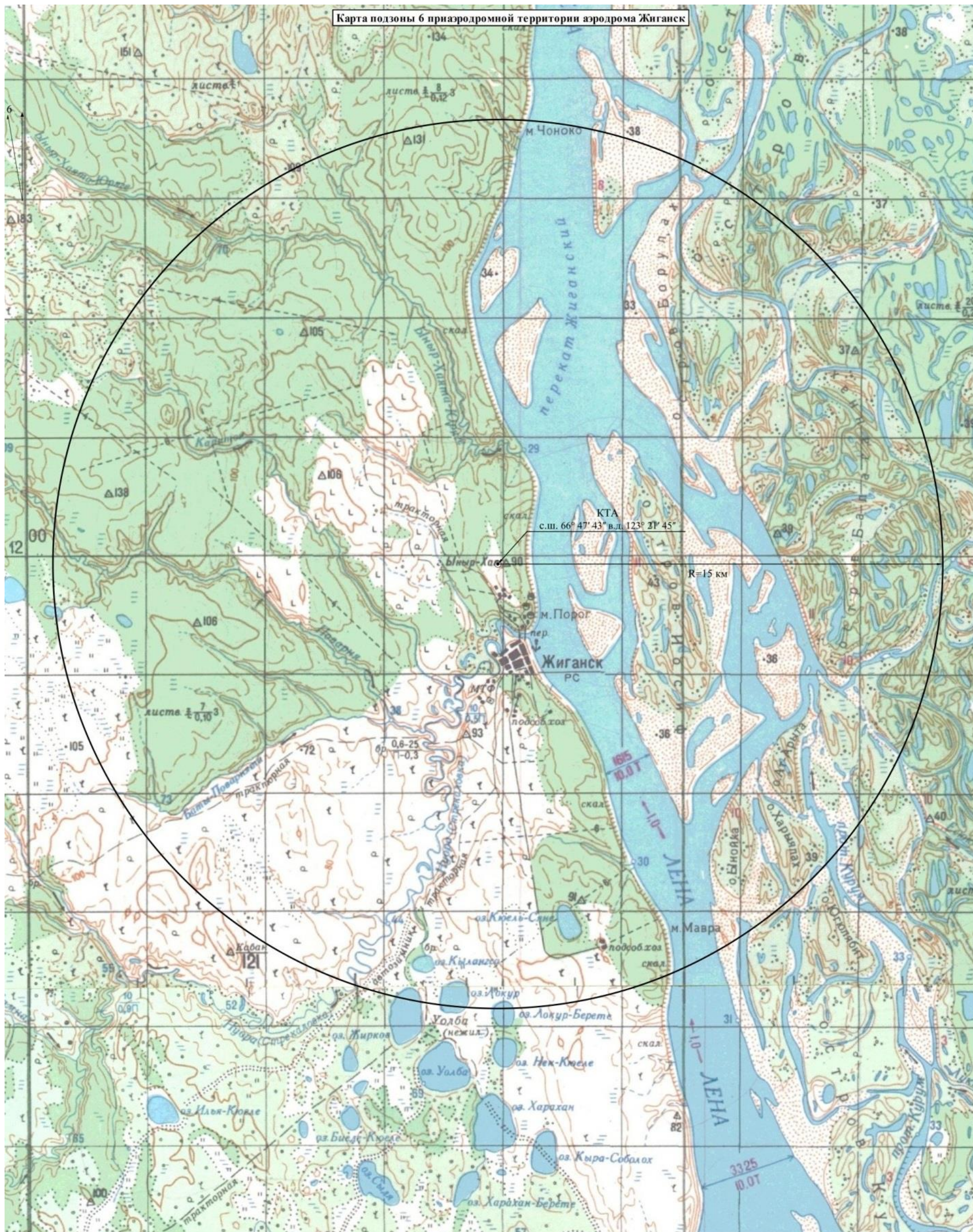
Карта подзоны 6 приаэродромной территории аэродрома Жиганск